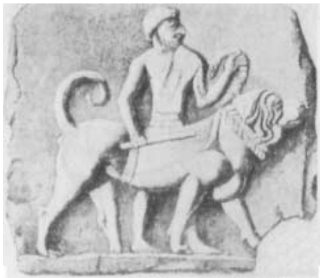
Staroasyrská doga (podle Lazarda)

úplně odřízli. Ač se Thébané prohlásili za vítěze díky svému smrtelně zraněnému vůdci Epameinondovi, bitva skončila nerozhodně a krátce nato museli město opustit. Je zajímavé, že v hrobech athénských válečníků se velmi často nacházejí početné kostry psů. Také Xerxes vedl při svém tažení proti Řecku s sebou psy, kteří se zúčastnili mnohých bitev.