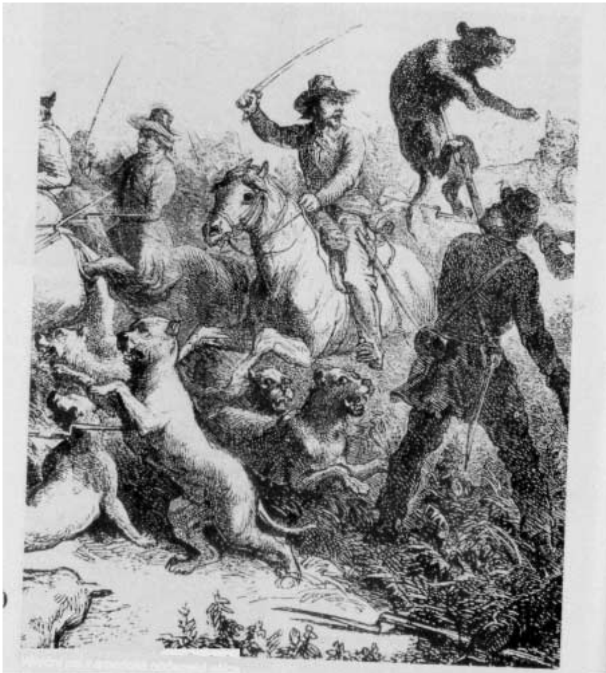
Váleční psi v americké občanské válce (ilustrace z amerického časopisu z roku 1867)