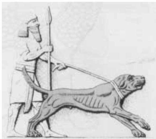
Asyrská doga: Basreliéf na stěně paláce v Ninive

K největšímu válečnému nasazení válečných psů došlo ve Francii za války francouzského krále Františka I. se španělským Karlem V. Jako pomocný sbor španělského krále nastoupilo 400 válečníků provázených 400 mohutnými mastify opatřenými širokými válečnými obojky. Tuto jednotku dodal anglický Jindřich VIII., který měl s Francouzi nevyřízené účty. Tato zvířata se stala pro Španěly