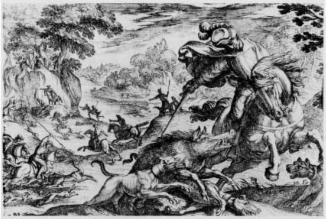
Antonio Tempesta (1555—1630): Lovecká scéna