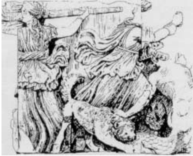
Reliéfy molossů na oltáři v Pergamonu

zervu. V Anglii za vlády Alžběty I. pomáhalo vévodovi z Essexu krvavě potlačit irské povstání 800 bojových psů.