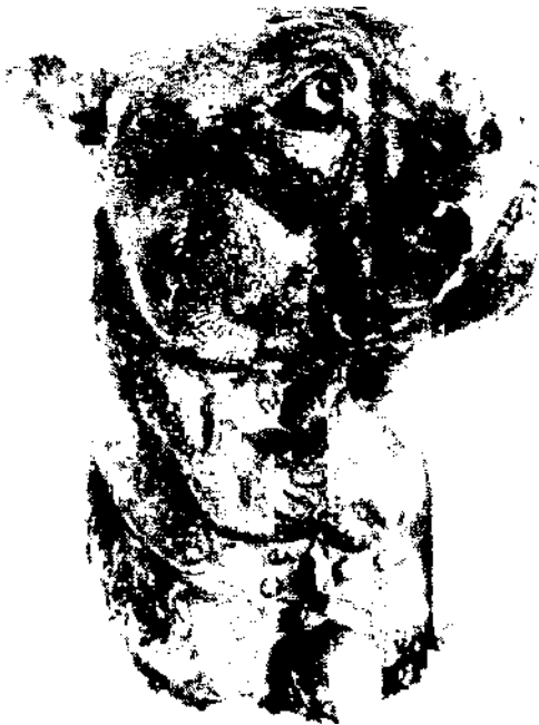
Hlava anglického bojového psa, bronzová plastika z 19. století