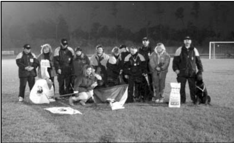
Ještě jedno foto a jede se domů..

S výkony na stopách se pro tento den zařadili naši mezi naprostou špičku a tak mohou i přes zmeškání slavnostní večere nastoupit k zaslouženému odpočinku. Ráno se brzy vstává a tak hurá „na kutě“.