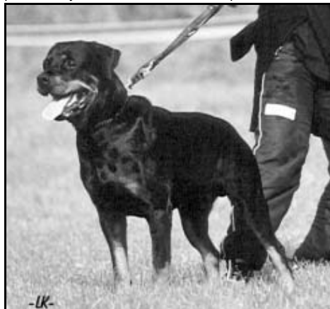
Bernie Bohemia RottBox

Uprostřed samotného oploceného cvičiště prostorná klubovna vybavená sociálními zařízeními, sprchami a nezbytnou kuchyní s několikařádkovým jídelníčkem a potřebným rozsahem tekutin. Za klubovnou se točilo na rožni maso pro mlsné jazýčky ... Pořadatelům patří za takto odvedenou práci velký dík. Dokonce snad i počasí měli na