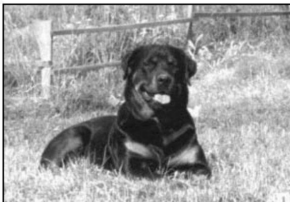
Birma z Krtů

hecují její otrávené následovníky, aby se trochu předvedli, docenují její nadšení.