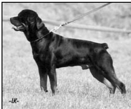
Kody z Křížanova

Chrudim byla ze všech směrů viditelně označena ukazateli navádějící návštěvníky i majitele psů k cvičišti umístěném na okraji města. Prostor velikosti přesahující rozměry fotbalového hřiště poskytoval spoustu místa jak pro parkování, tak i k samotnému předvedení plemeníků. Psi měli v okolí dostatek místa k venčení a tak nedocházelo,