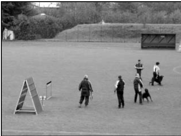
Trening Belgického družstva

Za tohoto počasí nastupuje v 16:00 hodin naše výprava omezena na psovody k slavnostnímu zahájení v prostoru stadionu. Nástup je kvůli nepřízní zkrácen na dobu nezbytně nutnou, tedy dobu k zahrání hymny a tímto okamžikem je tedy Mistrovství světa pro rok 2001 oficiálně zahájeno.