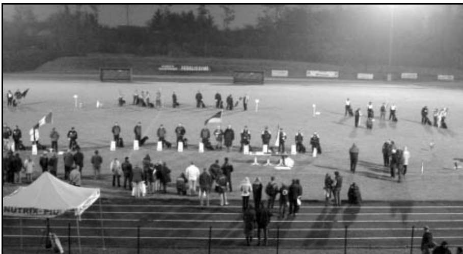
České družstvo dosáhlo 3 místa v soutěži družstev...

Čas kvapem běží a blíží se pomalu k číslům 14:50, jež je čas, který byl Dáše Macků a Valmontovi