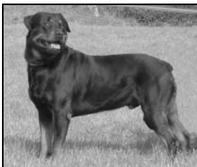
Uran van de Reyngaard

Předem děkujeme všem členům, kteří budou mít zájem podílet se na organizování akcí pořádaných pobočkou Morava, nebo budou mít své vlastní návrhy a nápady a nebudou váhat se ozvat či projevit svůj názor.