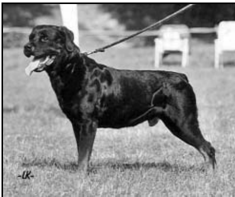
Simba v. Burathan

Svod plemeníků je chovatelským svátkem a je pravidelně pořádán jedenkrát za dva roky.