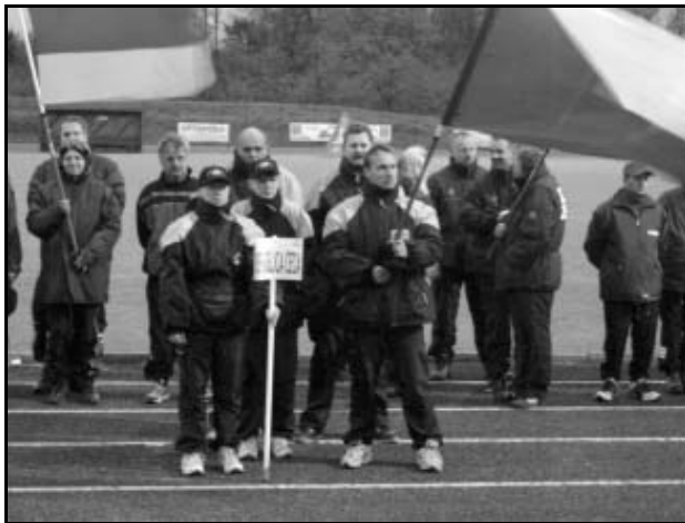
Slavnostní zahájení závodů

V dále jsou vidět zasněžené Alpy, fouká silný vítr, místy vykukuje sluníčko a teplota se pohybuje kolem 10 stupňů.