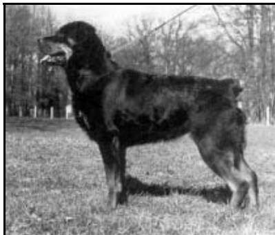
Chyra z Pohraniční stráže

ZPRAVODAJ - časopis Rottweiler klubu České republiky