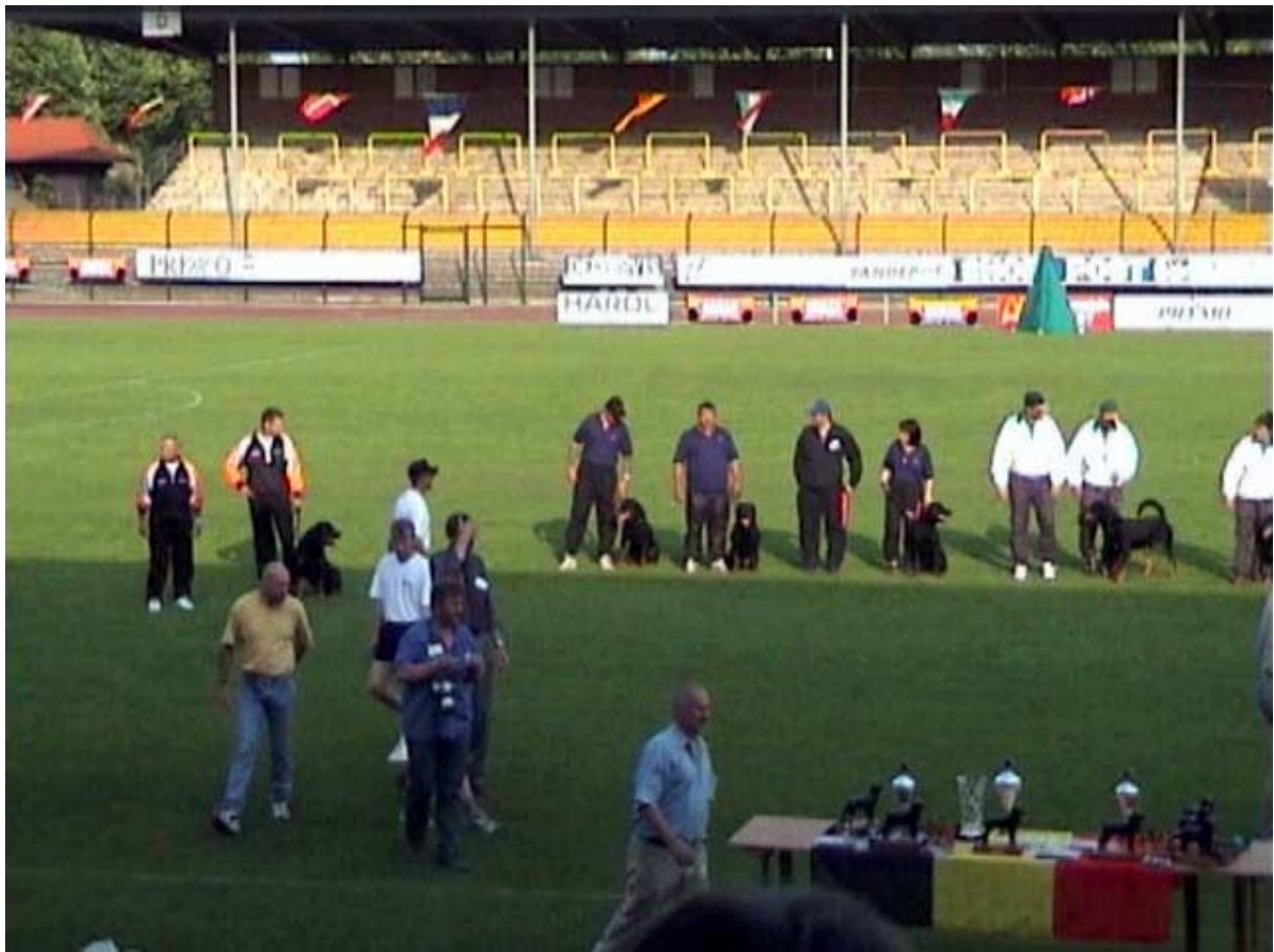
Český tým při oficiálním vyhlášení výsledků