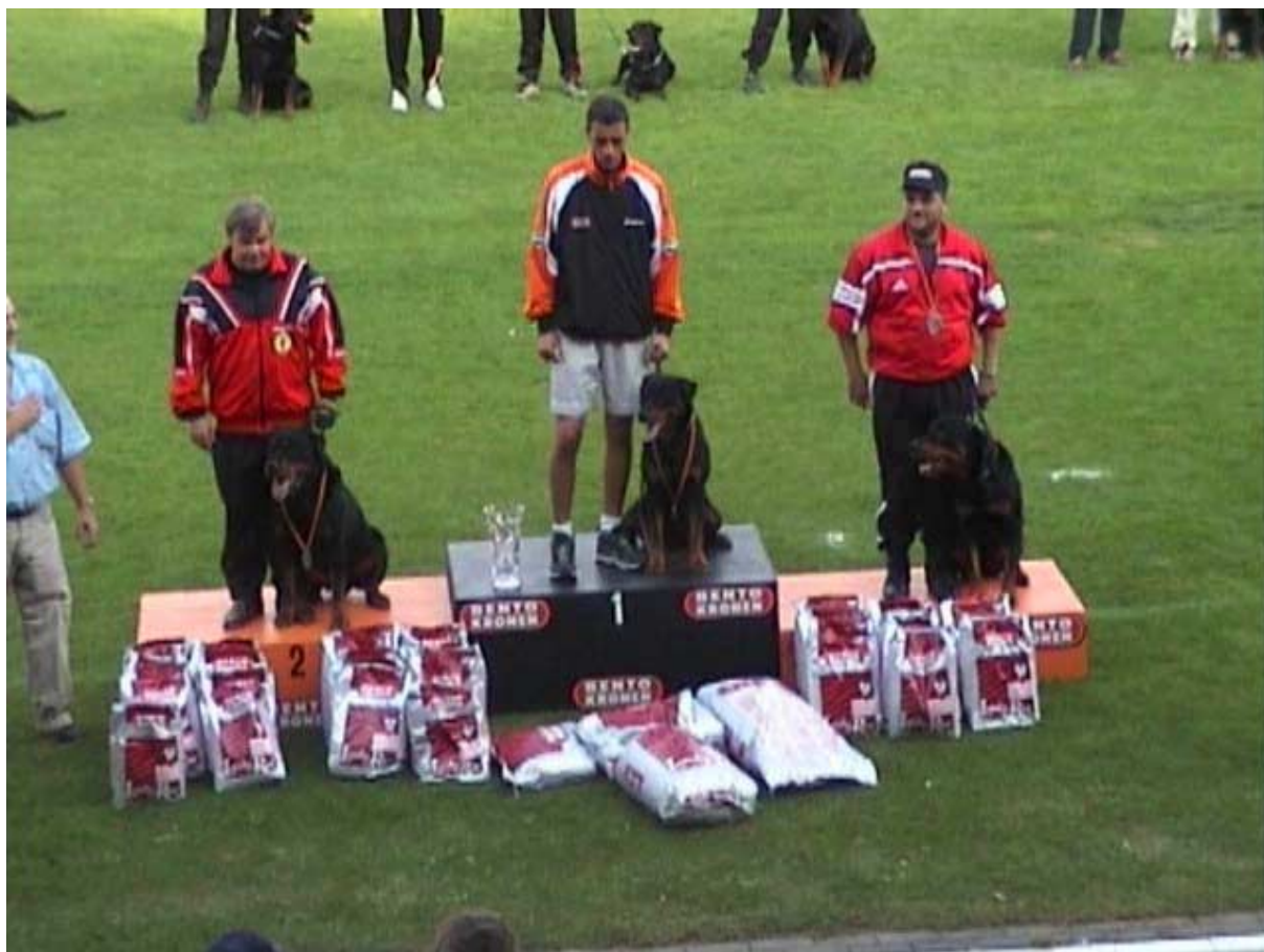
Vítězové MS RTW pro r. 2000