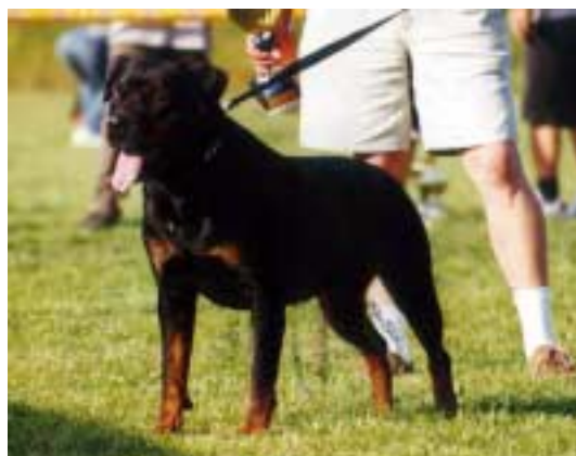
Alfa Rybowe doly Klubový vítěz, Vítěz plemene, Nejlepší fena