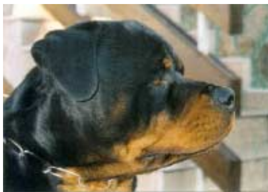
Gil Crni Lotos

Žádný z titulů zadávaných na klubové či speciální výstavě, není vázán na členství v RKČR.