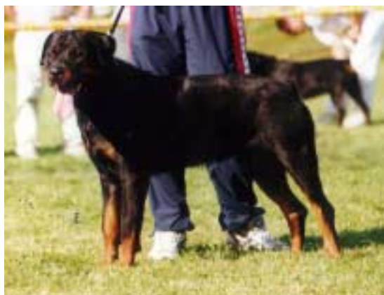
Xari vom Blackriesen výborný 1,CWC, Nejlepší pes výstavy